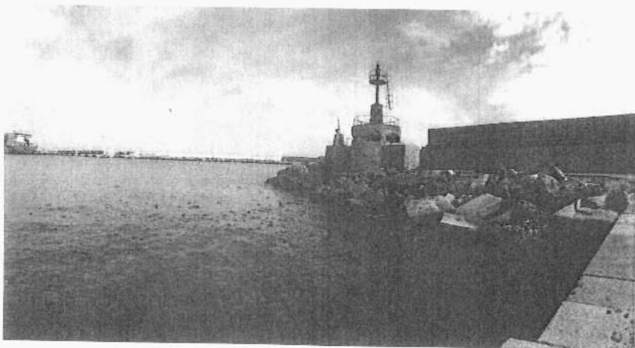
[Fortino militare - basamento fanale rosso]