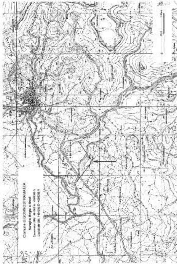
Stralcio cartografia IGM